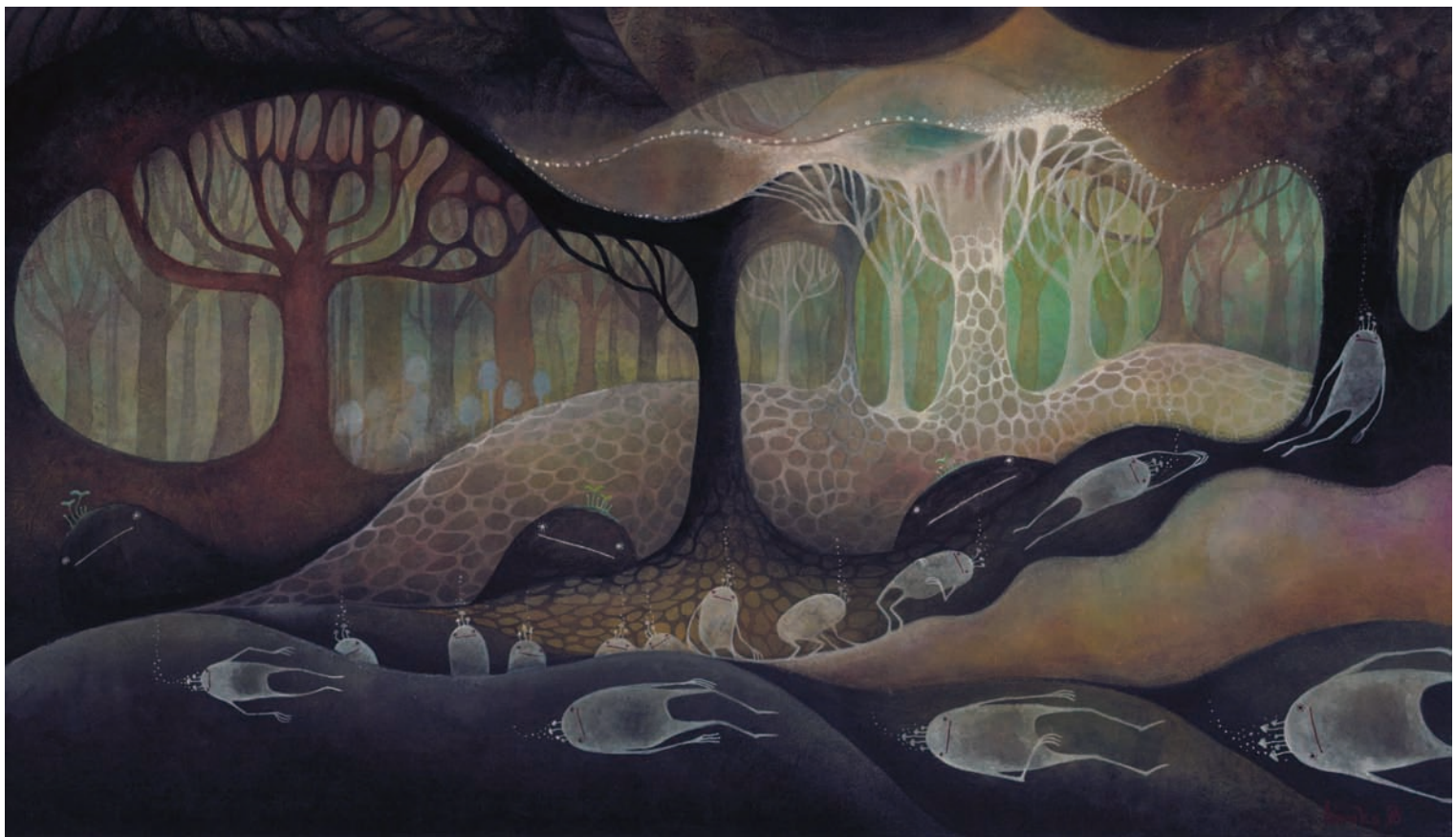
湿った土と落ち葉の匂い 420mm x730mm ロクタ紙 ガッシュ