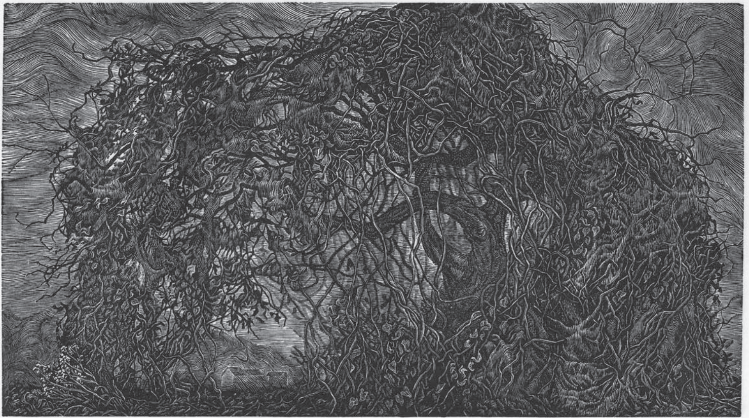
地鳴りを聞く 101 mm x 195 mm

私の使用する木口木版は、木材の年輪のある面、木口面を彫り進める技法です。西洋木版とも呼ばれ、主に黄楊、椿などの硬い木材が選ばれます。細密な表現ができることが特徴で、一度黒く染めた版面を、ビュランという彫刻刀で彫っていきます。