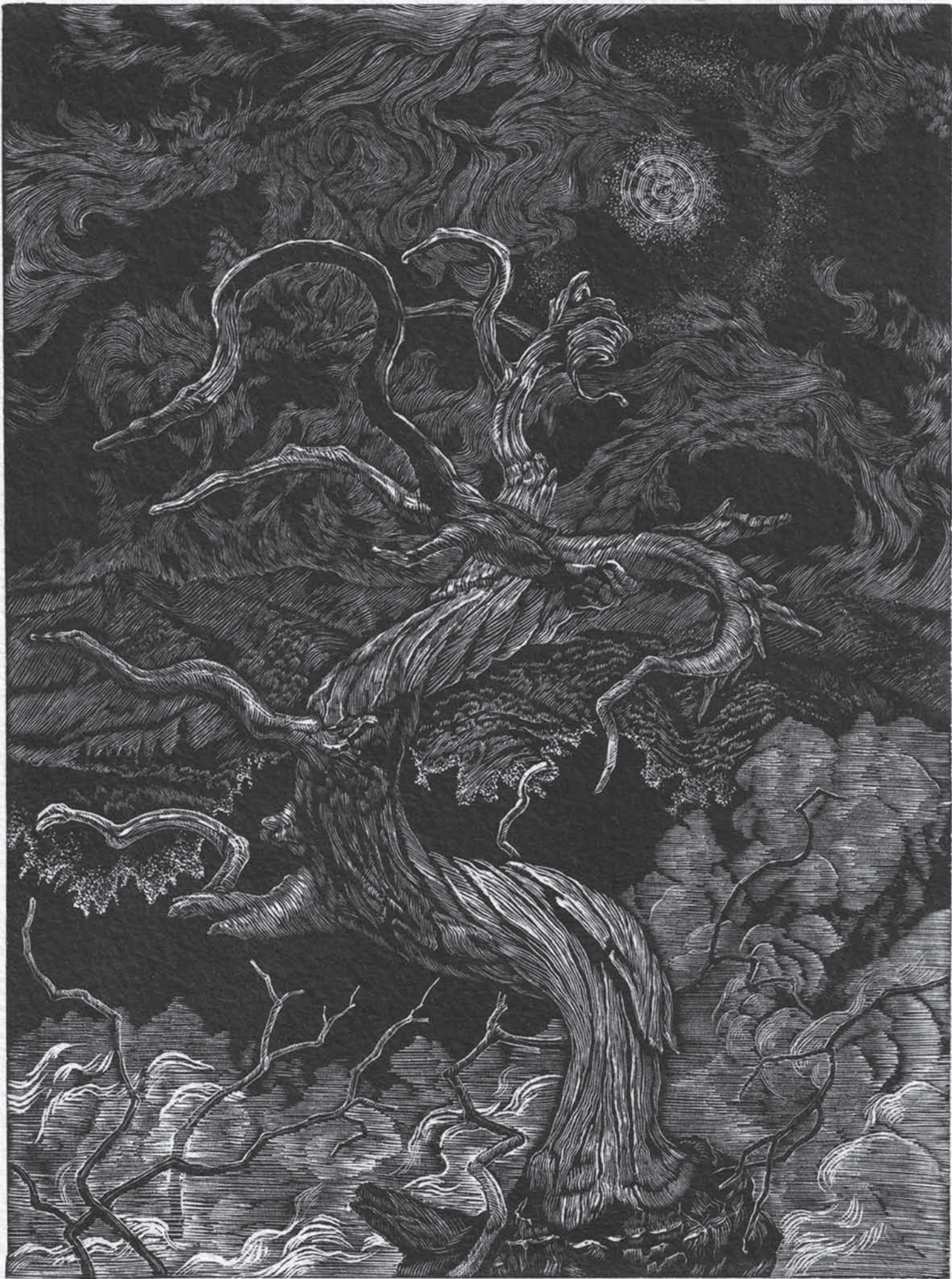
頂の夜 200 mm x 150 mm