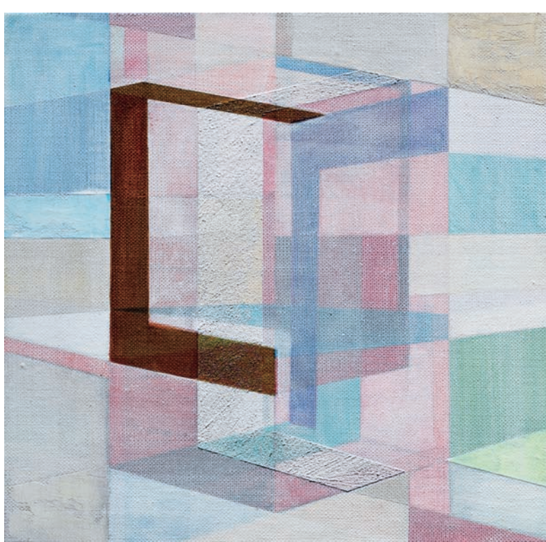
Some Delete / 275 x 275 x 22 mm oil on canvas 2018 / 62,000-