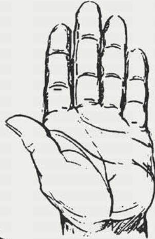
The hand as a tool.