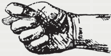
ランドルト環とエクササイズ—Exercise with Landolt C[i] 2018 / 紙にレーザープリント / 13,500 (フレーム付き)