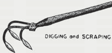
DIGGING and SCRAPING