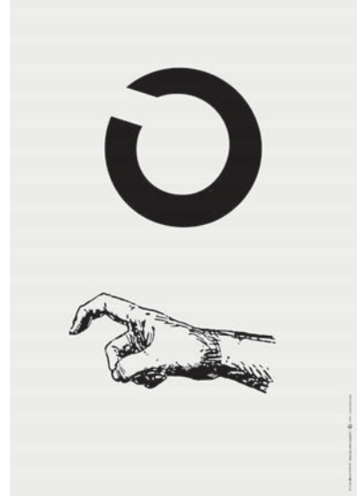
ランドルト環とエクササイズ—Exercise with Landolt C[iii] 2018 / 紙にレーザープリント / 13,500 (フレーム付き)