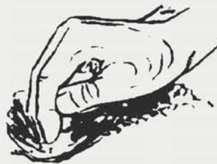
DIGGING and SCRAPING