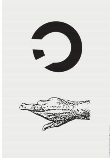
ランドルト環とエクササイズ—Exercise with Landolt C[iii] 2018 / 紙にレーザープリント / 13,500 (フレーム付き)